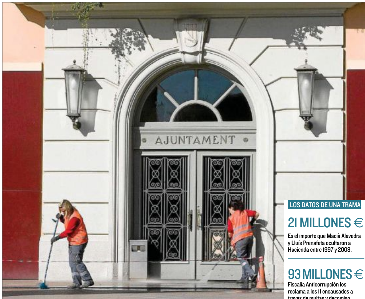
Dos barrenderas en el Ayuntamiento de Santa Coloma días después del arresto del ex alcalde, en 2009.