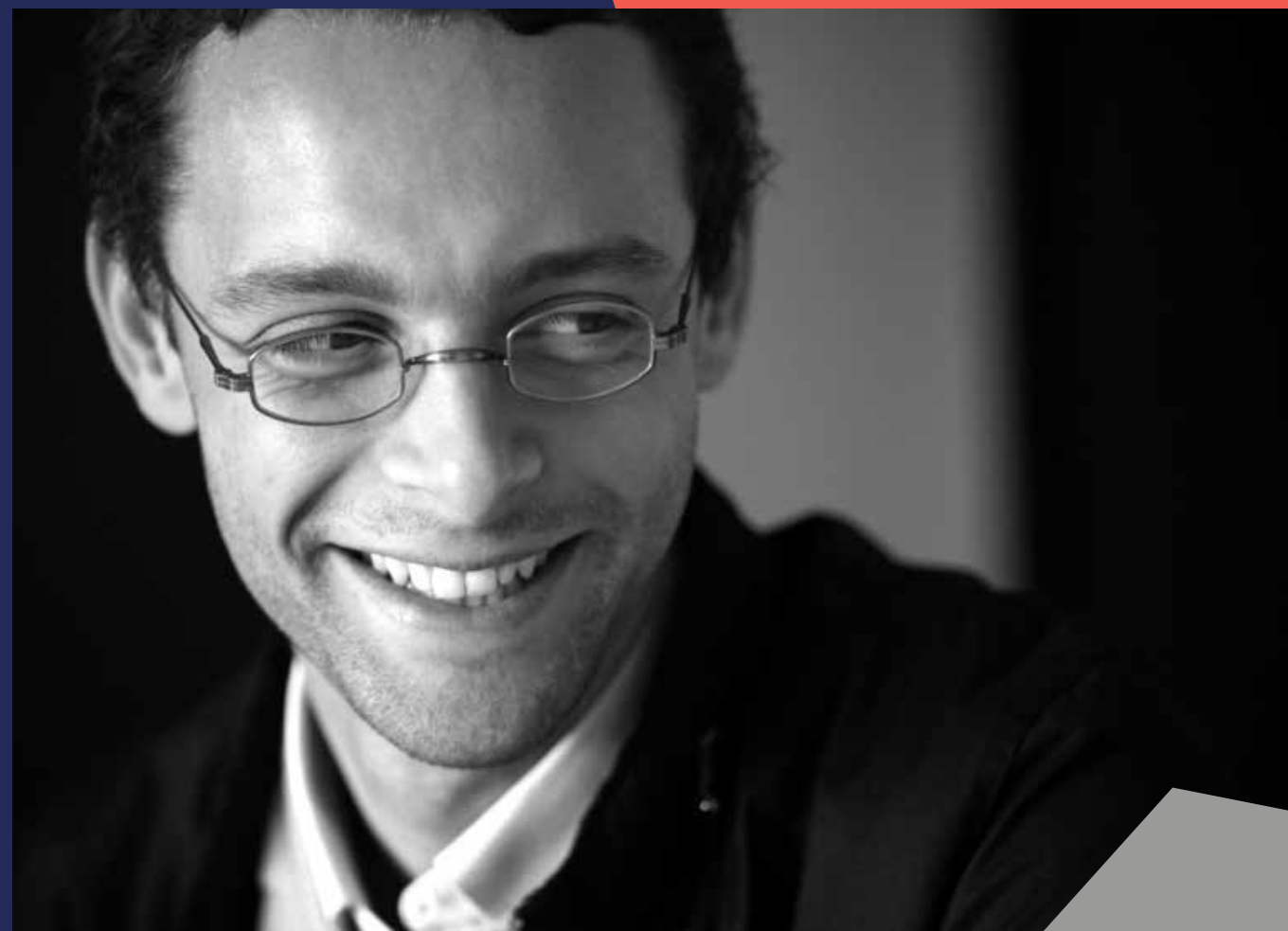
Dipòsit legal: B2722-2018

DIJOURS, 08.02.18 – 20.30 h Palau de la Música Catalana Petit Palau Palau Bach