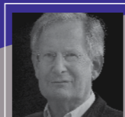
Monteverdi Il ritorno d'Ulisse in patria Sir John Eliot Gardiner