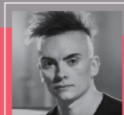
Bernstein Chichester psalms Carpenter, Orfeó Català i Cor de Cambra del Palau