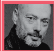
Schubert Winterreise Mark Padmore