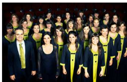
El Cor de Noies de l'Orfeó Català.

Publicat per Redaccio el 27 juny 2012 in Actualitat, Coral · 0 Comentaris