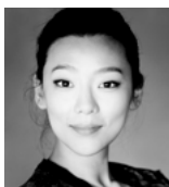
CLARA-JUMI KANG VIOLÍ

Artista d'impecable elegància i equilibri, ha forjat una carrera internacional actuant amb les principals orquestres i directors d'Àsia i Europa. Ha estat guardonada al Concurs Internacional Tchaikovsky 2015 i al Concurs Internacional de Violí d'Indianapolis 2010. També li han estat atorgats altres guardons com els primers premis al Concurs de violí de Seül (2009) i el Concurs de violí Sendai (2010).