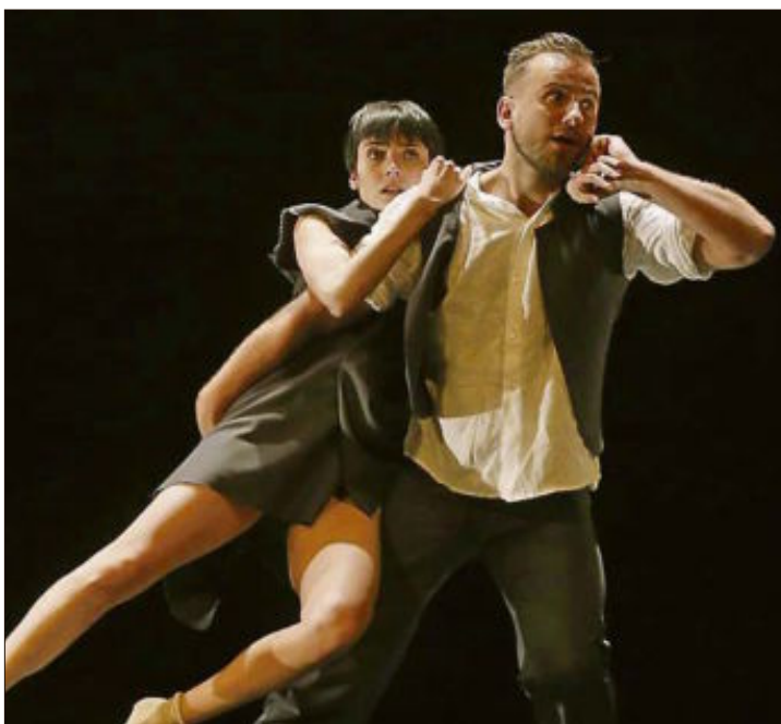
'Anhelos y tormentos', homenatge a Granados de la Companyia Nacional de Dansa.

Ara bé, Granados va escriure, naturalment, molta més música: centenars d'obres de piano; molta música de cambra (un magnífic trio, un quintet, una sonata per a violí i piano, etc.); i unes quantes òperes que són pràcticament desconegudes.